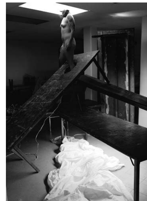
MARC AUDETTE, Lyne 2 from the series Art Class 010 , 122 cm x 91.5 cm Giclée on vellum, 2009/10

Classe d'art 010 constitue principalement une singulière série de tableaux vivants, composés et photographiés dans le local à l'université où Audette donne cours. Souvent rétroéclairées ou projetées comme des diapositives, les images d'une logique surréelle s'opposent aux formats pédagogiques traditionnels basés sur la transmission ordonnée de connaissances. Les motifs visuels se chevauchent et semblent se lier par association libre plutôt que par raisonnement méthodique. Ingéniosité ludique et inventivité narrative s'accordent pour créer une sorte d'inconscient d'école de beaux-arts empli de potentiel insoupçonné. Dans ce terrain vierge, des modèles vivants se juchent sur des meubles modifiés, leurs têtes disparaissent dans des rectangles blancs de lumière fluorescente ; une pile bancale de tables de dessin donne des leçons sur le point de fuite et la mise en abîme. Délibéré, complexe et rigoureusement réflexif, Classe d'art 010 révèle son « art » sans sacrifier la